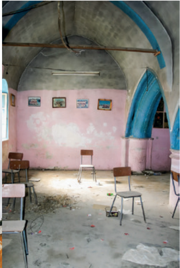
33, 34, 35, 36. Η εκκλησία και η σύληση τάφων στο νεκροταφείο του χωριού Λάπαθος