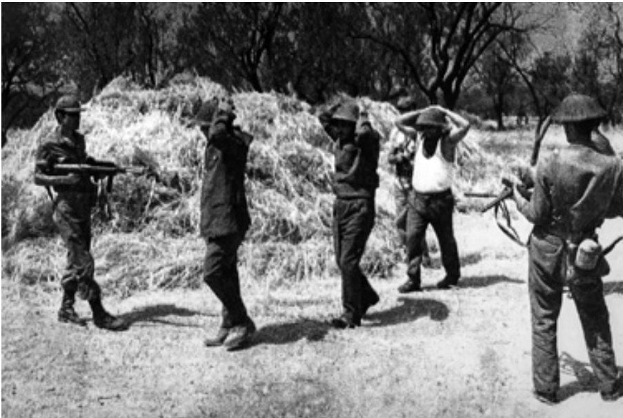
18, 19. Greek Cypriot civilians arrested by the Turkish troops