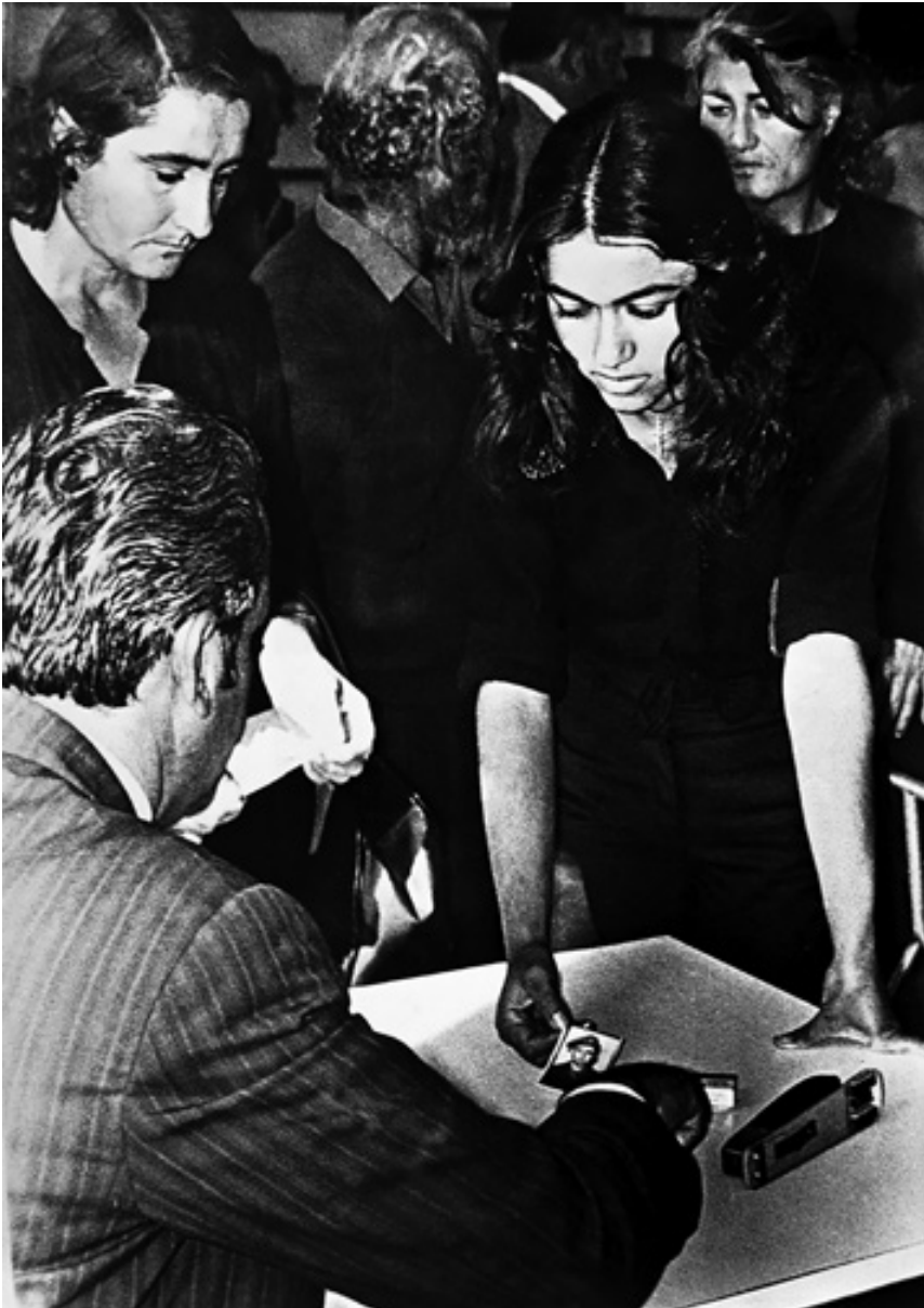
101. Registering data of the missing persons as a result of the Turkish army operations in Cyprus