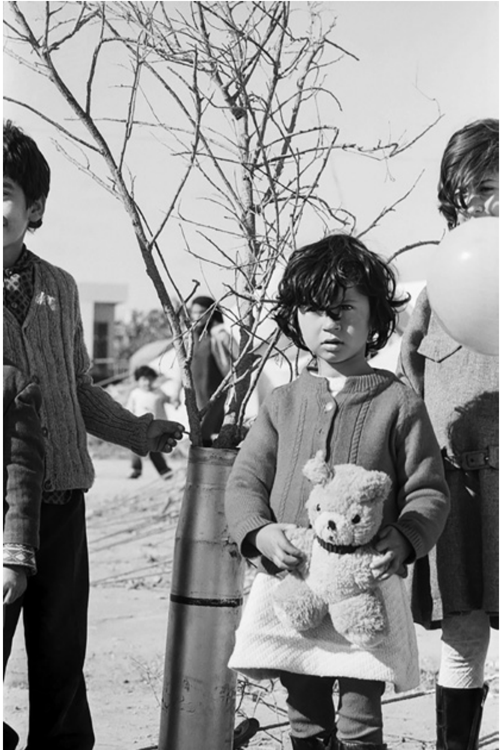
76, 77, 78. A Christmas tree decorated by children in Stavrou's refugee camp