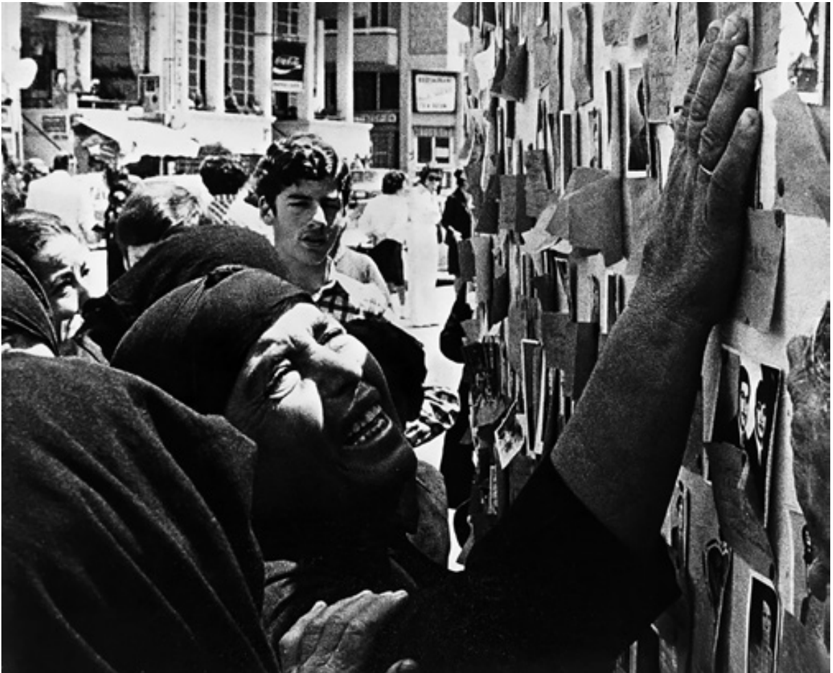
93, 94. Missing persons' photos in Eleftheria Square